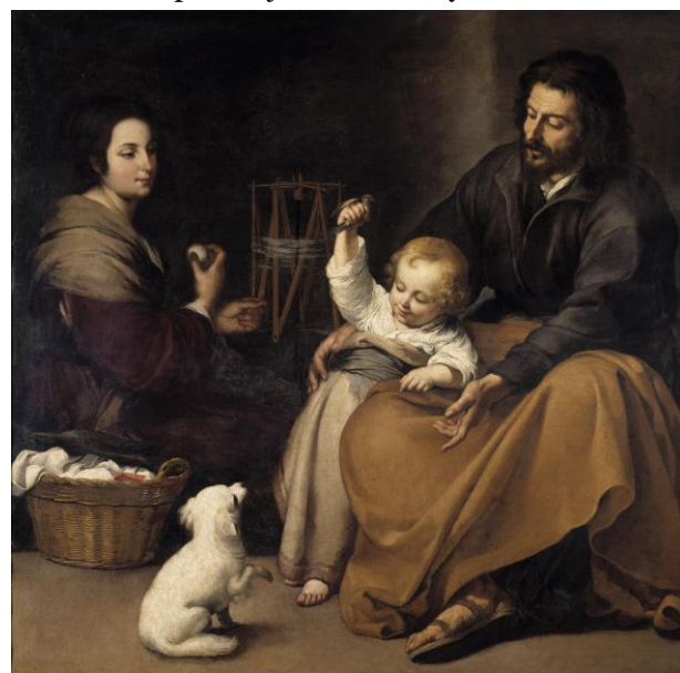
Svatá rodina, Bartolomé Esteban Murillo (1650), Museo del Prado, Madrid

Poučným se příběh stává teprve v jisté polaritě. Jasnými protipóly jsou v něm např. Herodes vs. Josef s Marií. Všichni jmenovaní jsou konfrontováni s životními těžkostmi, hroutícími se plány či pocity ohrožení. Herodes představuje člověka, který chce mít sebe i druhé pod kontrolou, je silně sebestředný. Známa zásada psychologického směru C. G. Junga říká, že čím více se upínáme k představě vlastní dokonalosti, tím temnější a destruktivnější síly uzavíráme do svého nitra. Herodes tak navenek působí jako velikašský stavitel a filantrop, uvnitř ovšem trpí chorobnou úzkostí a paranoiou a neváhá za svého