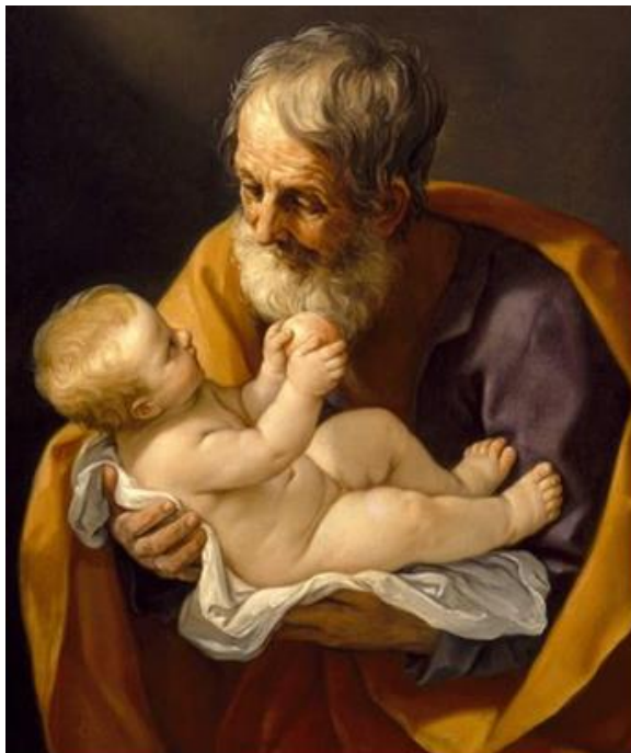
Josef a Ježíš – Guido Reni (1640)

V uplynulém půlroce jsme v našem sboru o nedělích promýšleli starozákonní příběh praotce Abrahama. V biblickém vyprávění to byl on, kdo se jako první rozhodl spoléhat na Hospodina, byť mu z toho neplynuly žádné konkrétní zisky. Bůh jej zahrnul mnoha sliby, jejich naplnění bylo ale za Abrahamova života v nedohlednu. Abraham představuje úsvit nové víry. Byl to on, kdo se vzepřel pověře a začal psát kapitoly nové teologie. Jeho vztah k Bohu nestál na osobním prospěchu, neuvažoval ekonomicky, neptal se, co mu víra reálně přinese za jeho života. Snad hledal smysl svého života, snad jej chtěl zakotvit na trvalejších hodnotách, snad ho lákal vztah se Stvořitelem, jenž je v posledku jedinou nadějí nad vši lidskou pomíjivostí. Abraham se vydal na cestu do neznámé země. Na stará kolena se v očích svých vrstevníků zbláznil, když opustil všechny civilizační jistoty a vydal se cestou meditace neúrodnou pustinou. Právem tak tento praotec víry symbolizuje začátek, novou kapitolu náboženské historie světa.