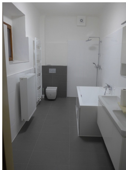
přiložené fotografie: nová kuchyň v rekonstruovaném bytě kostelníka a nová kuchyň s koupelnou v rekonstruovaném bytě faráře

Přeji vám všem, každému jednotlivě i celému sboru mnoho Božího požehnání. Pán ať žehná kázání Slova a vašemu společenství v Lysé!